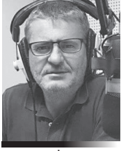
Γράφει ο Κώστας Νάνος Αρχισυντάκτης του “Ράδιο Cosmos”

Ο Πρόεδρος της Δημοκρατίας κ. Νίκος Χριστοδουλίδης δέχθηκε την Τετάρτη στο Προεδρικό Μέγαρο, τον Γενικό Ελεγκτή της Δημοκρατίας κ. Οδυσσέα Μιχαηλίδη. Μετά τη συνάντηση, ο κ. Μιχαηλίδης δήλωσε στους δημοσιογράφους ότι επρόκειτο για εθιμοτυπική συνάντηση, προσθέτοντας ότι «πιστεύω ότι ήταν πάρα πολύ εποικοδομητική, σε πολύ καλό κλίμα. Πιστεύω οι στόχοι της Ελεγκτικής Υπηρεσίας το να αναδεικνύει