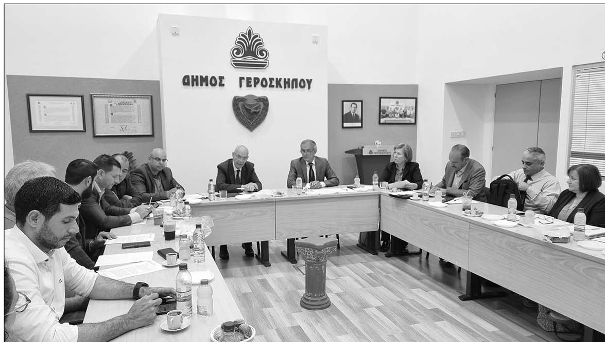
Τα μέλη του Δημοτικού Συμβουλίου κατά την χθεσινή συνάντηση που είχαν στο Δ. Μέγαρο με τον Υπουργό Μεταφορών, Επικοινωνιών και Έργων Αλέξη Βαφεάδη, τόνισαν ότι δεν πρόκειται αν δώσουν απόψεις για την ανέγερση του ξενοδοχείου εάν οι ανασκαφές δεν επεκταθούν σε όλο το τεμάχιο της εκκλησίας, καθώς στο σημείο όπου χωροθετείται το κτίριο δεν έχει γίνει καμία απολύτως ανασκαφή.

Πολύ επείγουσα ανάγκη χαρακτήρισε ο Υπουργός Μεταφορών την επέκταση του αεροδρομίου της Πάφου. Μιλώντας νωρίτερα χτες το πρωί στο Radiocosmos με αφορμή την επίσκεψη του στην Πάφο, ο κ. Βαφεάδης δήλωσε αισιόδοξος ότι θα βρεθούν λύσεις και θα προχωρήσουν οι εργασίες επέκτασης των κτηριακών εγκαταστάσεων του αεροδρομίου από την ανάδοχο εταιρεία, ώστε να καλύπτει πλήρως τις ανάγκες της