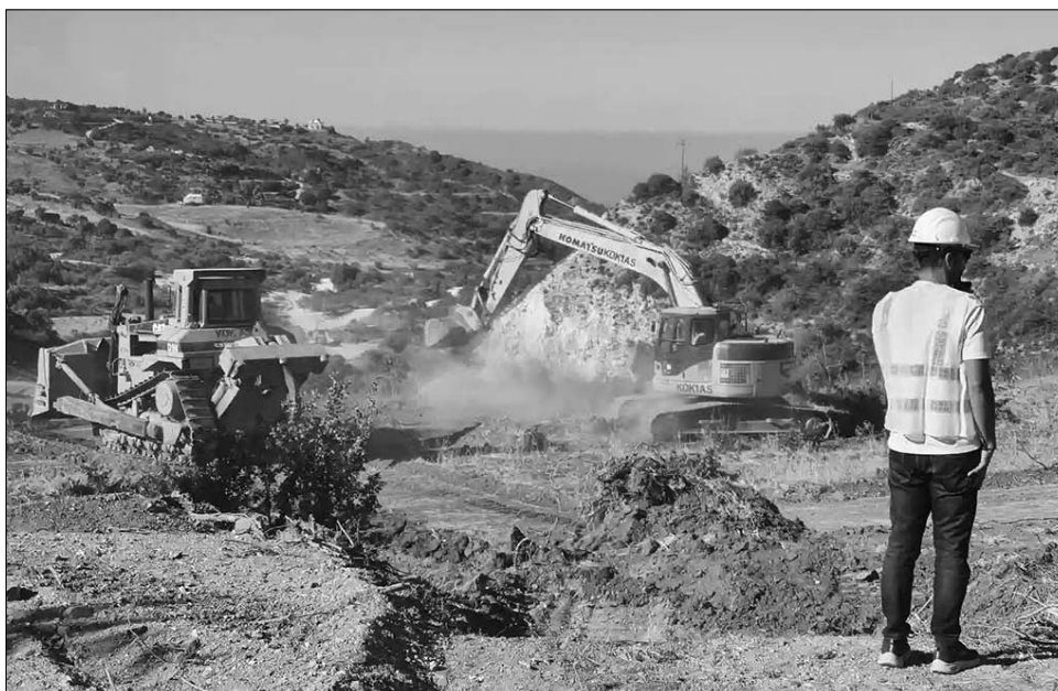
Το τμήμα του αυτοκινητόδρομου από το Στρουμπί μέχρι την Πόλη Χρυσοχούς έχει πολύ λιγότερα τεχνικά έργα και παρότι το μήκος είναι παρόμοιο με 15 χιλιόμετρα το κόστος εκτιμάται ότι θα είναι μικρότερο κατά 50%.

Σε προχωρημένο στάδιο είναι, επίσης, η θεμελίωση της γέφυρας και ανατολικά της Μαραθούνας. Προεργασίες άρχισαν και για τις σήραγγες του δρόμου. Το έργο αφορά στη μελέτη και την κατασκευή δρόμου δύο λωρίδων κυκλοφορίας αρχικά, από την Αγία Μαρινούδα μέχρι το Στρουμπί, με μήκος 15,5 χιλιομέτρων και κόστος 87 εκατομμυρίων ευρώ. Μελλοντικά, ο δρόμος θα αναβαθμιστεί σε αυτοκινητόδρομο τεσσάρων λωρίδων. Η όδευση αρχίζει από τον αυτοκινητόδρομο Λεμεσού – Πάφου παρά την