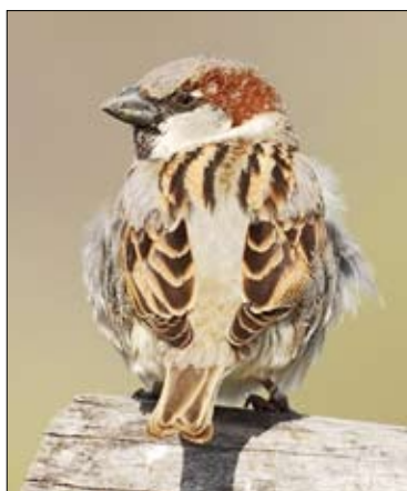
στον κήπο σας.

Υπολογίστε πόσο μεγάλο πρόκειται να γίνει μετά από μερικά χρόνια κάθε φυτό (δέντρο ή θάμνος) που πρόκειται να φυτέψετε τώρα. Θυμηθείτε ότι το χαριτωμένο δεντάκι που φυτέψατε σήμερα, μπορεί να γίνει σε μερικά χρόνια ένας γίγαντας που θα καταλαμβάνει όλο το ζωτικό χώρο