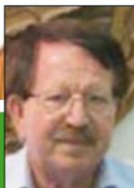
Γράφει ο Παναγιώτης Κασπάρης Γεωπόνος - Συνεργάτης