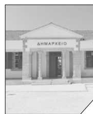
Δ. Σ. Π. Χρυσόχους