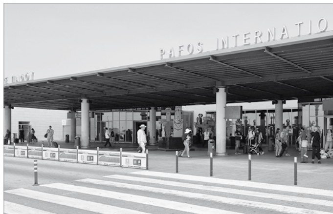
Η Hermes Airports, ακολουθώντας με συνέπεια τη στρατηγική ανάπτυξης δρομολογίων και υποστήριξης των αεροπορικών εταιρειών, συνεργάζεται με 55 αεροπορικές εταιρίες οι οποίες πραγματοποιούν πτήσεις από και προς τα αεροδρόμια Λάρνακας και Πάφου, με 155 δρομολόγια σε 39 χώρες.

Αξιοσημείωτο είναι το γεγονός, πως η απώλεια της Ρωσικής και Ουκρανικής αγοράς που αποτελούσε πέραν του 20% της συνολικής επιβατικής κίνησης έχει αναπληρωθεί, με την ανάπτυξη άλλων υφιστάμενων αγορών, κάποιες εκ των οποίων παρουσιάζουν αύξηση πέραν του 50% σε σχέση με το 2019, ενώ σημαντική συνεισφορά έχουν και οι νέες