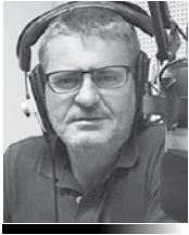
Γράφει ο Κώστας Νάνος Αρχισυντάκτης του “ Rádío Cosmos ”

Η πρόσφατη έκθεση του Γ.Γ του ΟΗΕ για το κυπριακό χαρακτηρίστηκε ως πολιτική ίσως αποστάσεων όμως αυτό δεν ήταν έκπληξη. Αυτό που προκαλεί όμως έκπληξη είναι οι δηλώσεις που έγιναν για την έκθεση από κυβερνητικούς παράγοντες και οι χλιαρές αντιδράσεις. Ο ΓΓ του ΟΗΕ, Αντόνιο Γκουτέρες, σημειώνει πως ένα σημαντικό βήμα προς τα μπρος για το Κυπριακό θα ήταν μια συμφωνία με τις πλευρές για τον διορισμό ενός απεσταλμένου των Ηνωμένων Εθνών που θα μπορούσε να διε-