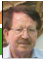
Γράφει ο Παναγιώτης Κασπάρης Γεωπόνος - Συνεργάτης