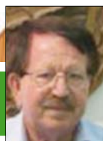
Γράφει ο Παναγιώτης Κασπάρης Γεωπόνος - Συνεργάτης