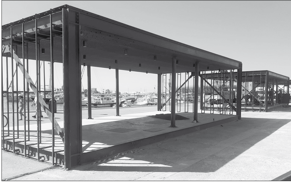
Το συνολικό κόστος κατασκευής τους ξεπερνά τις 200.000 ευρώ όμως από την πρώτη στιγμή που εμφανίστηκαν στην περιοχή υπήρξαν έντονες αντιδράσεις.

Π αρά την κατακραυγή για τα αντιαισθητικά μεταλλικά σκιάδια στο Λιμανάκι ο Δήμος Πάφου αντί να τα απομακρύνει επιχειρεί να τα τροποποιήσει προκαλώντας νέες επικρίσεις από πολίτες οι οποίοι καταλογίζουν στην τοπική αρχή ατομία να επανορθώσουν την λανθασμένη απόφαση τους για την τοποθέτηση των σκιαδίων. Τις τελευταία μέρες η εταιρία που ενοικίασε τα κτίρια της ΑΛΚ στο Λιμανάκι μετά και την παρέμβαση του Τμήματος Αρχαιοτήτων προχωράει σε τροποποιήσεις των μεταλλικών