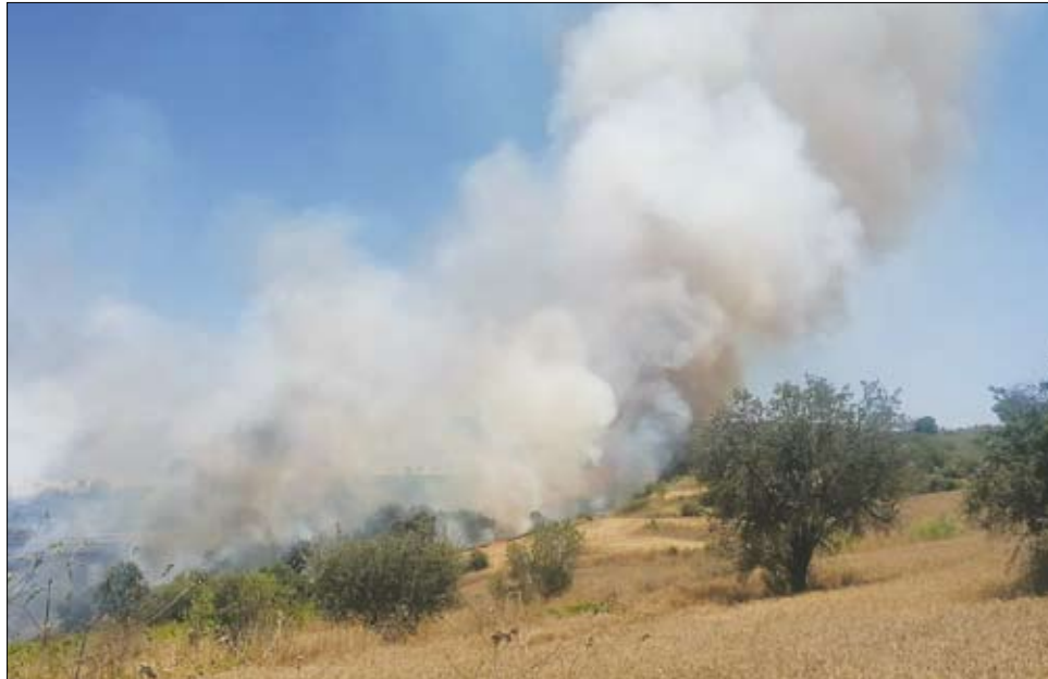
Για την κατάσβεση της φωτιάς ανταποκρίθηκαν πέντε συνολικά πυροσβεστικά οχήματα από την πόλη και επαρχία Πάφου, ενεργοποιήθηκαν πέντε εναέρια μέσα, δύο ελικόπτερα και τρία αεροσκάφη

Με βάση τις πρώτες εκτιμήσεις η πυρκαγιά ξεκίνησε από τα όρια αμπελιού και δεν αποκλείεται να οφείλεται σε εργασίες που πιθανόν να γίνονταν στο συγκεκριμένο χώρο.