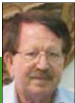
Γράφει ο Παναγιώτης Κασπάρης Γεωπόνος - Συνεργάτης