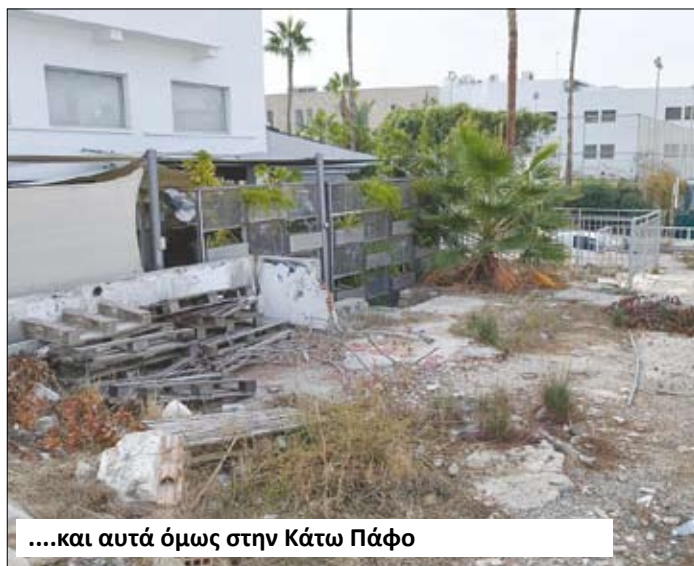
...και αυτά όμως στην Κάτω Πάφο