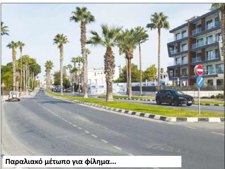
Παραλιακό μέτωπο για φίλημα...