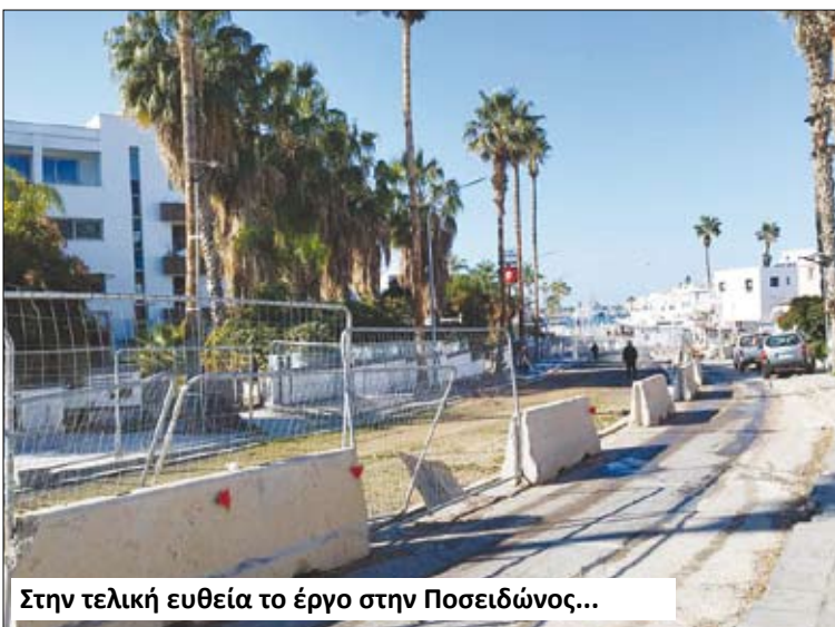
Στην τελική ευθεία το έργο στην Ποσειδώνος...