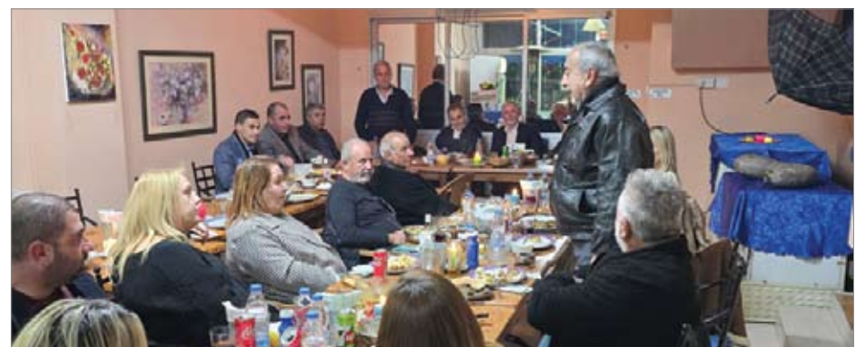
δουλέψει ακούραστα και με πάθος, με περσισηγάπη για την γενέτειρα του την Γε-