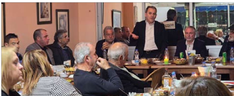
Ο υποψήφιος αντιδήμαρχος Γεροσκήπου στο νεοσύστατο δήμο ανατολικής Πάφου κύ-

Για περισσότερες πληροφορίες στα τηλέφω-