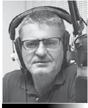
Γράφει ο Κώστας Νάνος Αρχισυντάκτης του "Ράδιο Cosmos"

Πονοκέφαλο προκαλεί επίσης και η σύγκρουση εξουσιών προέδρου του επαρχιακού Οργανισμού, ο οποίος θα εκλέγεται - άρα θα έχει εκτελεστικές εξουσίες - και του γενικού διευθυντή του οργανισμού. Ότι και αν γίνει, το επόμενο τετράμηνο που απομένει μέχρι τις εκλογές, δεν θα είναι αρκετό για να εφαρμοστεί η μεταρρύθμιση σε ότι αφορά τους επαρχιακούς οργανισμούς.