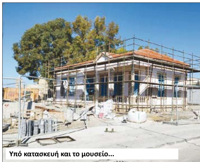
Υπό κατασκευή και το μουσείο...